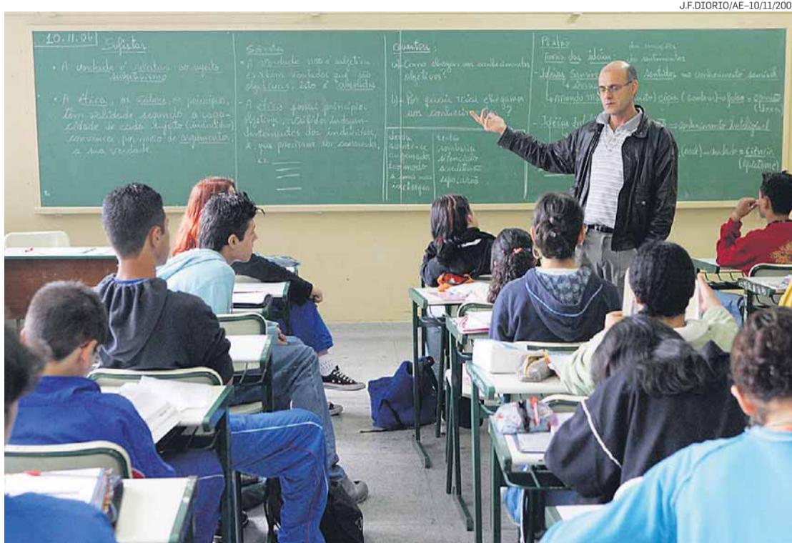
Nova grade. Alunos de escola estadual na zona norte de São Paulo assistem à aula de filosofia